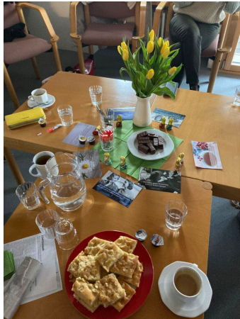
Bild: Erzählcafé zum Thema Freundschaft in Bülach

Das nationale Werkstattgespräch fand am 22. März 2024 im Sentitreff in Luzern statt und drehte sich mit Vorträgen zum Körperbild, zu einfacher Sprache und zur Wichtigkeit von gegenseitigem Respekt ebenfalls ums Thema. Vor dem Werkstattgespräch fand die Mitgliederversammlung statt. Das Werkstattgespräch und die Mitgliederversammlung fanden mehrsprachig, und mehrheitlich auf Deutsch statt.