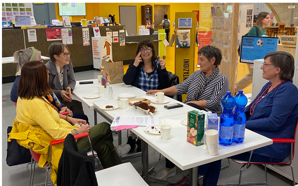
Foto: Erzählcafé vom 16. April 2024 an der «Esposizione fotografica ( www.storiadellefamiglie.ch ) im Filanda in Mendrisio.