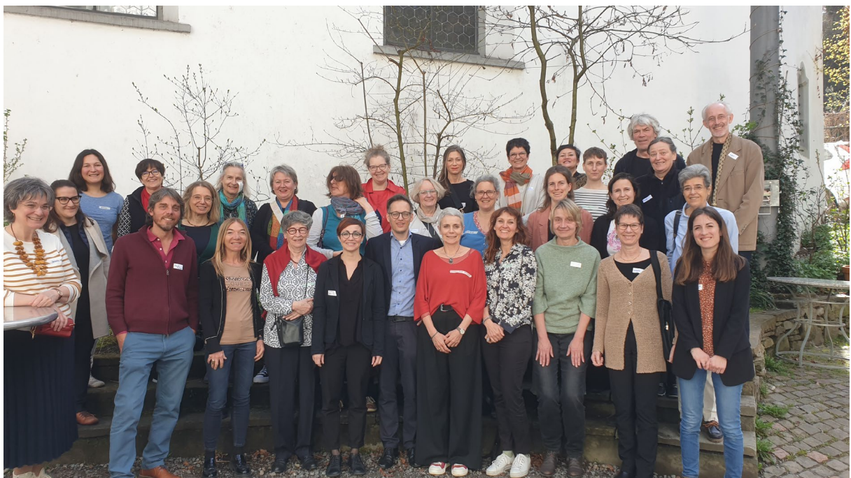
Bild: Gruppenfoto an der Mitgliederversammlung 2024 in Luzern / Photo de groupe, assemblée générale 2024, Lucerne / Foto in gruppo, assemblea dei soci 2024, Lucerna

Das nationale Werkstattgespräch fand am 22. März 2024 im Sentitreff in Luzern statt und drehte sich mit Vorträgen zum Körperbild, zu einfacher Sprache und zur Wichtigkeit von gegenseitigem Respekt ebenfalls ums Thema. Vor dem Werkstattgespräch fand die Mitgliederversammlung statt. Das Werkstattgespräch und die Mitgliederversammlung fanden mehrsprachig, und mehrheitlich auf Deutsch statt.