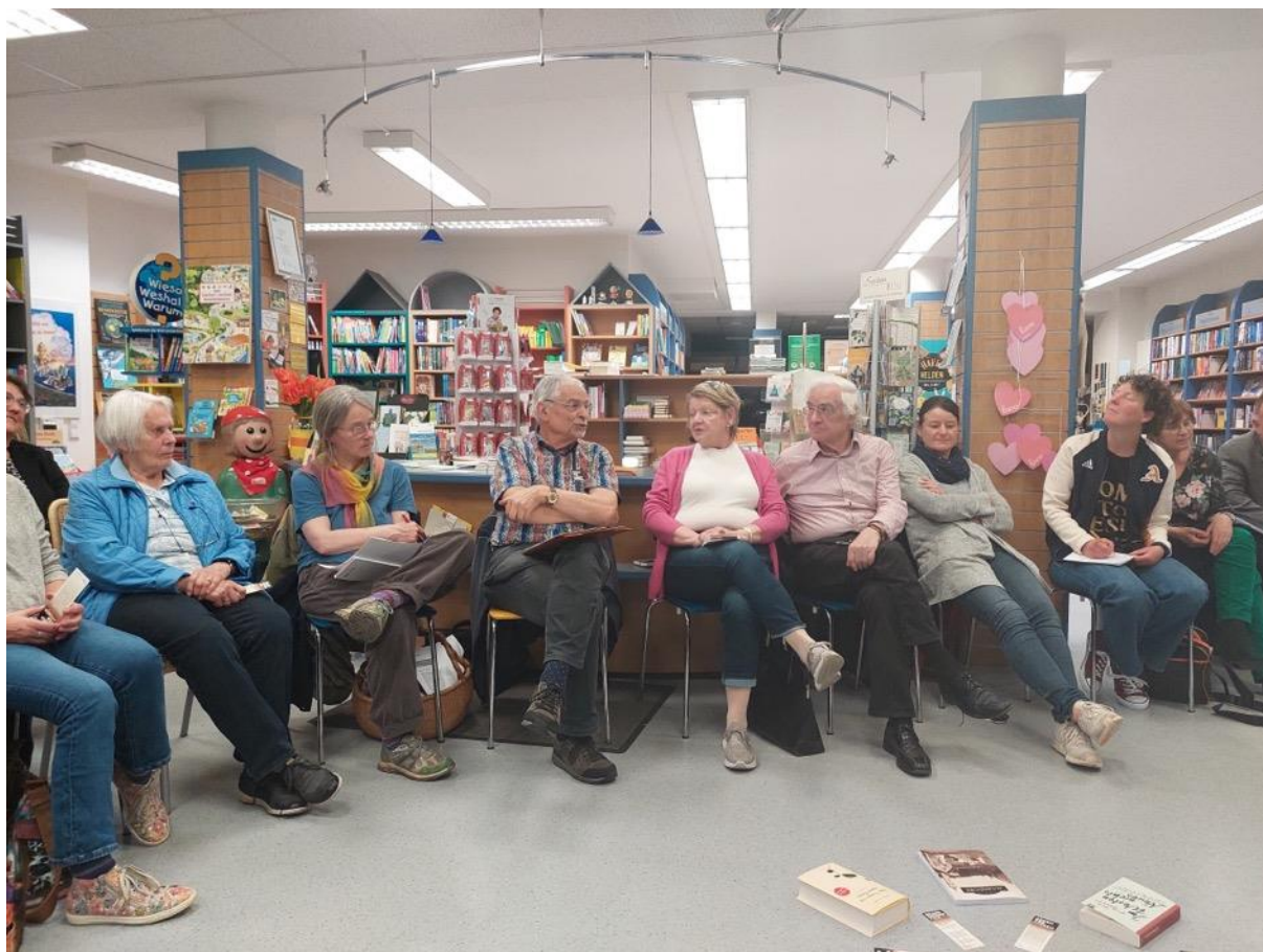
Un caffè narrativo in una biblioteca (foto: Rhea Braunwalder)