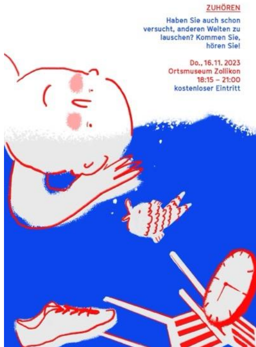
Immagine: volantino per l'evento di apertura delle Giornate dei caffè narrativi 2023 presso l'Ortsmuseum Zollikon.